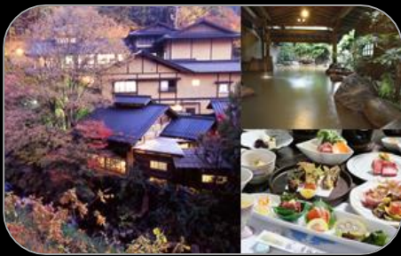
熊本・黒川温泉 夢竜胆