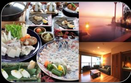
大分・別府上人ヶ浜温泉 潮騒の宿 晴海