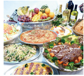
夕食一例（バイキング）