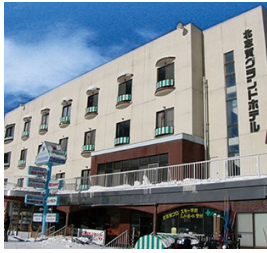
北志賀グランドホテル本館・外観